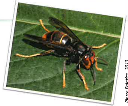
Pierre Falatico, 2013

Le frelon asiatique est très souvent confondu avec le frelon européen. Voici comment les différencier :