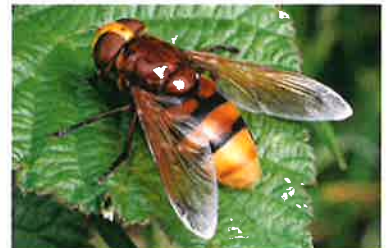
Volucelle zonée Volucella zonaria (Pierre Falatico, 2005)