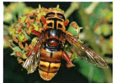
Milésie faux-frelon Milesia crabroniformis (Pierre Falatico, 2009)