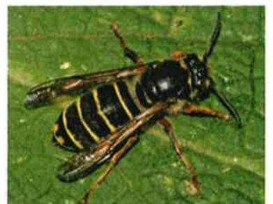
Guêpe des buissons Dolichovespula media (Jeremy Early, 2010)