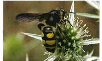
Scolie Colpa sexmaculata (Pierre Falatico, 2010)