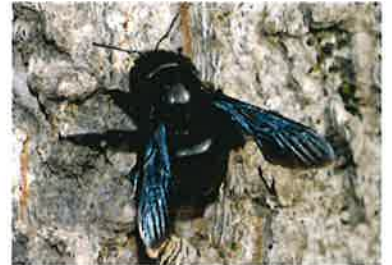
Abeille charpentière Xylocopa violacea (Pierre Falatico, 2010)