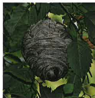
The High Fin Sperm Whale, 2011

De couleur grise, son ouverture de petite taille est située à la base du nid et légèrement excentrée