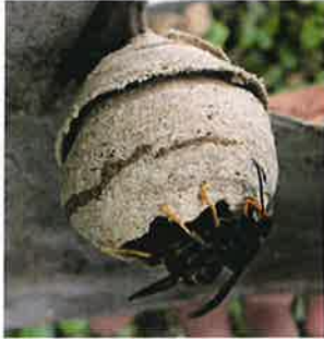
Basile Naillon, 2012

Au printemps, la femelle fondatrice construit seule un nid primaire dans lequel elle élève la première génération d'ouvrières. Ce nid de petite taille est souvent construit à faible hauteur.